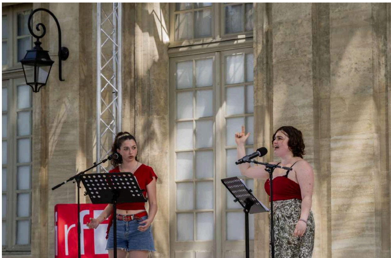
© Pascal Gely - Lectures RFI - Avignon