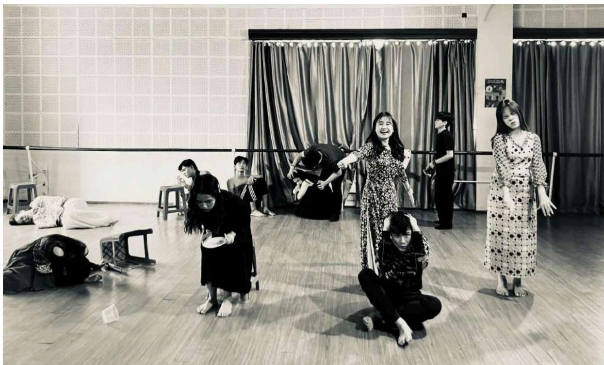
© Sophie Kokaj – expertises pédagogiques SKDA Hanoï